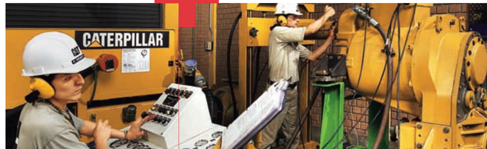
Sala de pruebas de transmisiones en el CRC +

La compañía tiene su oficina central en Lima y sucursales en las ciudades de Piura, Chiclayo, Cajamarca, Trujillo, Chimbote, Huaraz, Arequipa y Cusco, las cuales se localizan en propiedades de la compañía + También cuenta con oficinas en las ciudades de Ica, Huancayo, Ayacucho y Huaypetuhe, en locales alquilados, excepto la de Huaypetuhe que es propia +