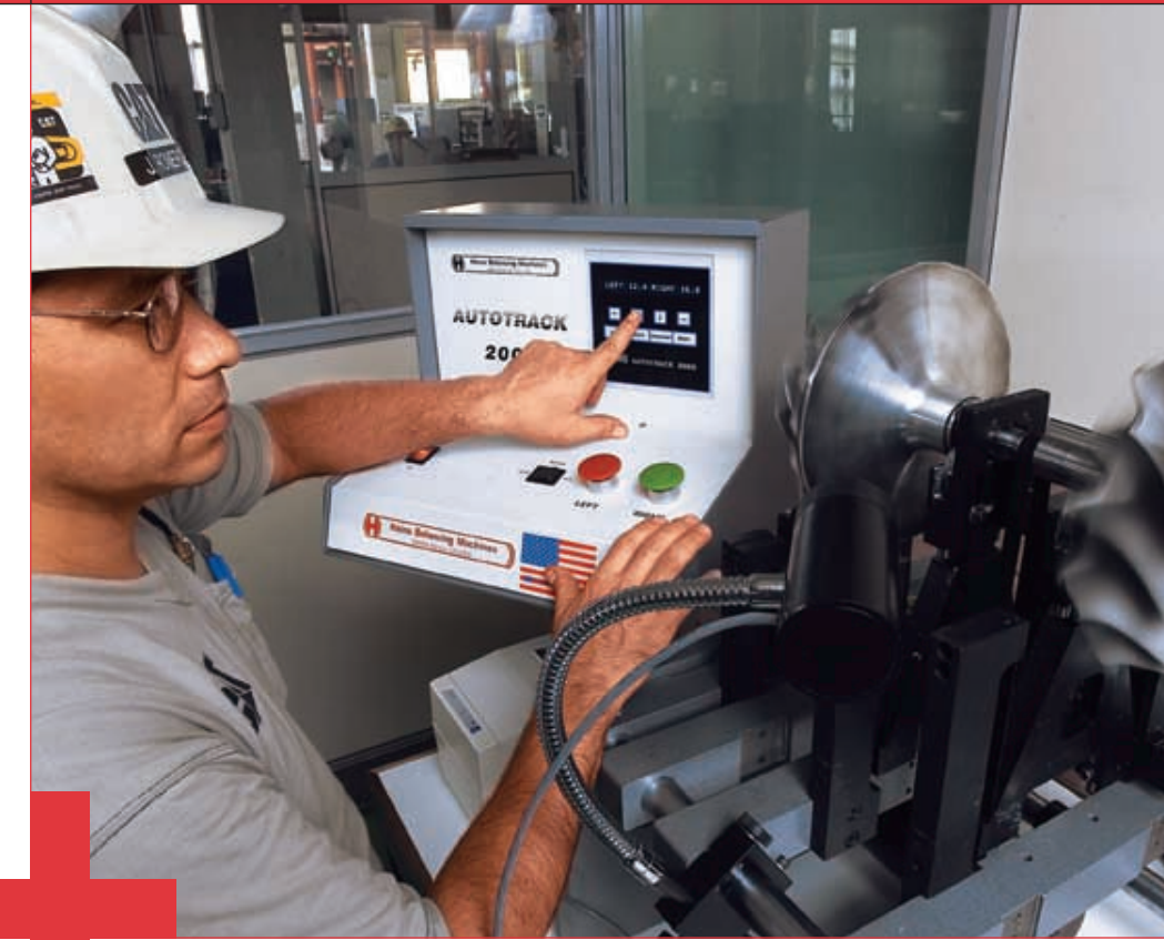
Balaceo electrónico de turboalimentadores en el CRC +

Los financiamientos bajo esta línea alcanzaron al cierre del año 2002 US$45.5 millones, todos a un plazo de 12 meses + Asimismo, cabe señalar el gran apoyo de Caterpillar Financial Services (brazo financiero de Caterpillar) quien mantuvo una línea de US$70 millones a la empresa, dentro de la cual se realizó a lo largo del año operaciones de mediano plazo + La utilización de dicha línea al 31 de diciembre del 2002 alcanzó US$50 millones, bajo operaciones directas y US$4.8 millones bajo operaciones indirectas + Puede mencionarse en particular una operación por US$22 millones a un plazo de 7.5 años con un pago del 50% al final de dicho plazo + En el mes de setiembre la empresa obtuvo la aprobación de Exim Bank para una línea de financiamiento de importaciones a un plazo de 3 años por un monto de US$10 millones +