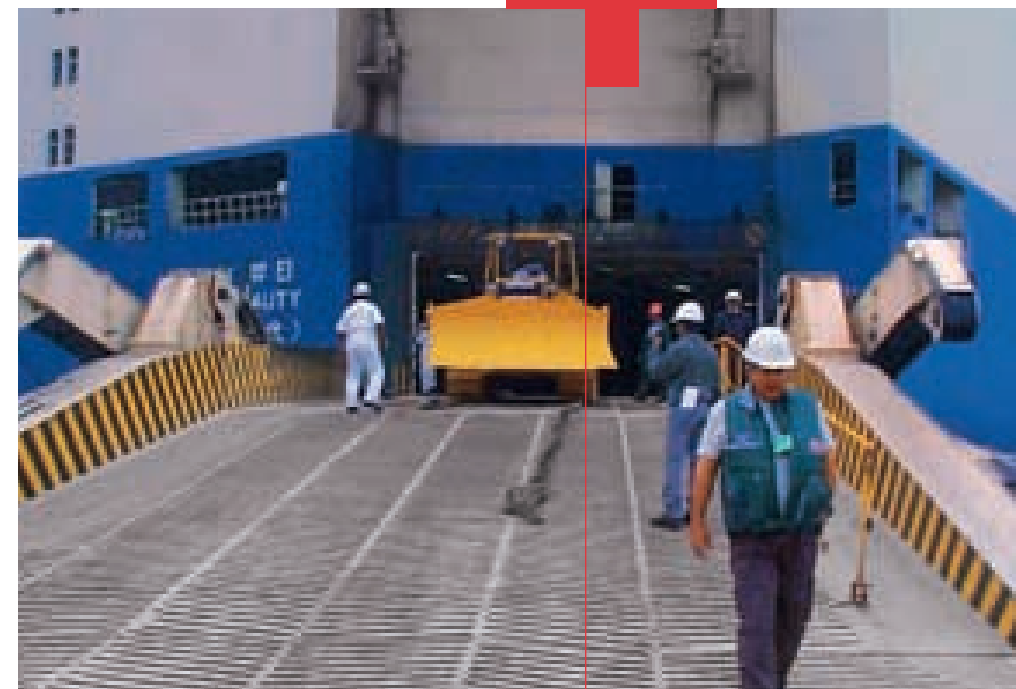
Desembarque de lote reciente de unidades CAT para el programa MiPre +

La participación de los trabajadores e impuesto a la renta registrados al 31 de diciembre del año 2002 y 2001 han sido calculados de acuerdo con las normas tributarias y contables vigentes +