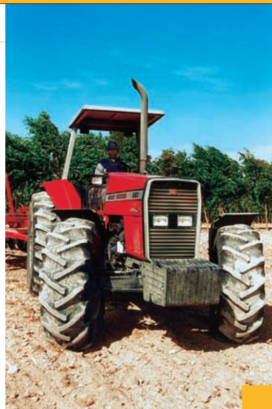
Tractor Massey Ferguson +