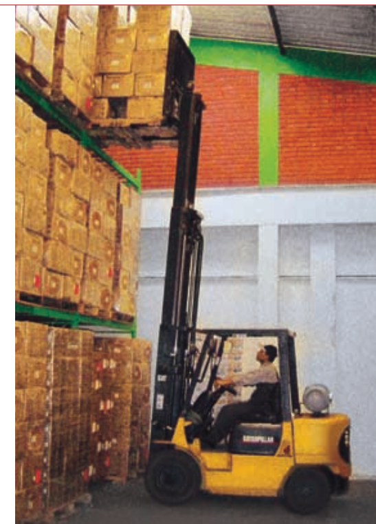
Servicio de almacenamiento en racks en Depósitos EFE +

La compañía también mantiene una participación accionaria de 12.98% en La Positiva Seguros y Reaseguros S.A., una empresa constituida en el Perú el año 1937, y cuya actividad económica principal es la contratación de seguros generales y de vida +