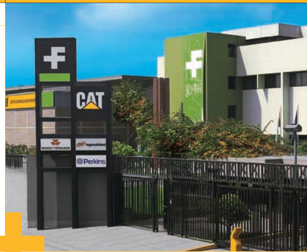
Local principal de Ferreyros en sus 80 años +