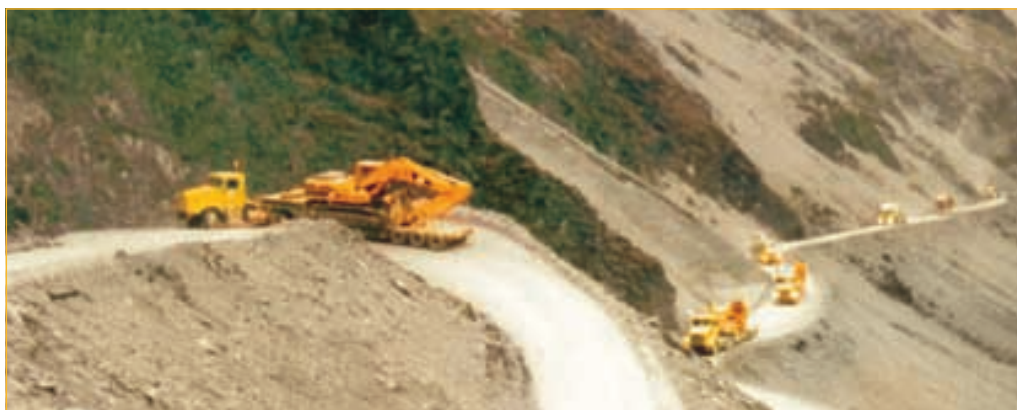
Convoy de camiones Kenworth T800 transportando kits con maquinaria CAT a Antamina +