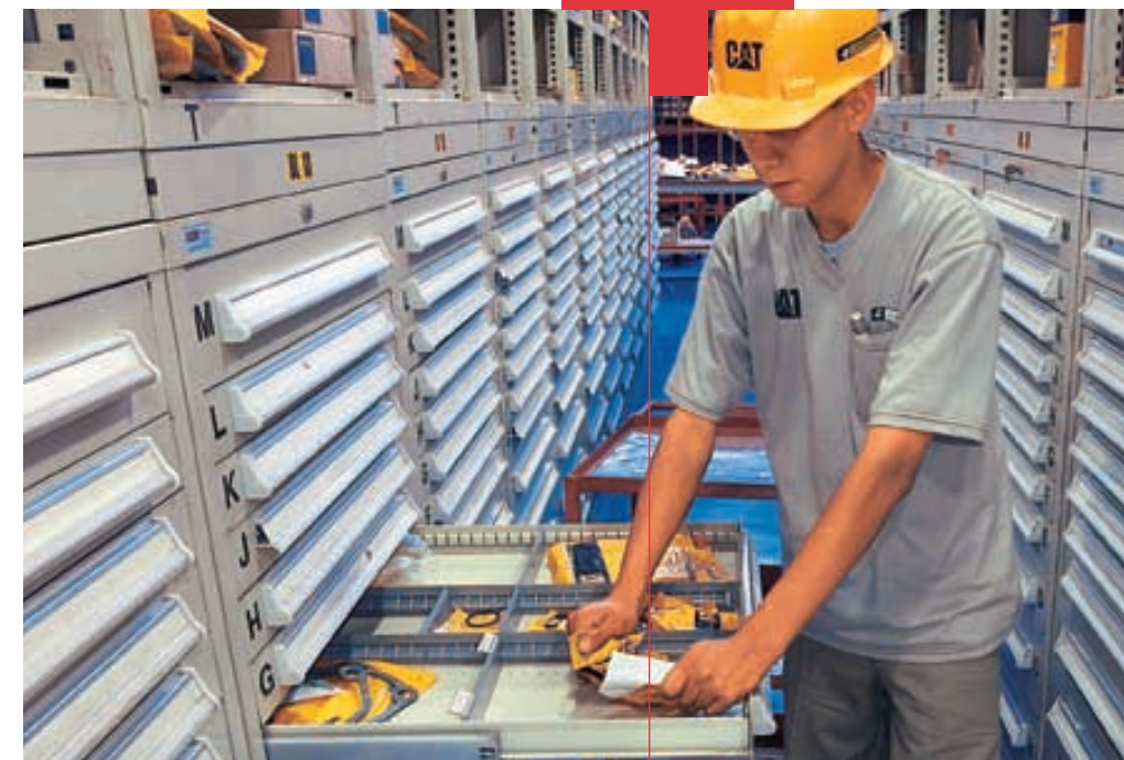
Almacén central de Repuestos con aprox. 20,000 items almacenados según las normas de CAT +